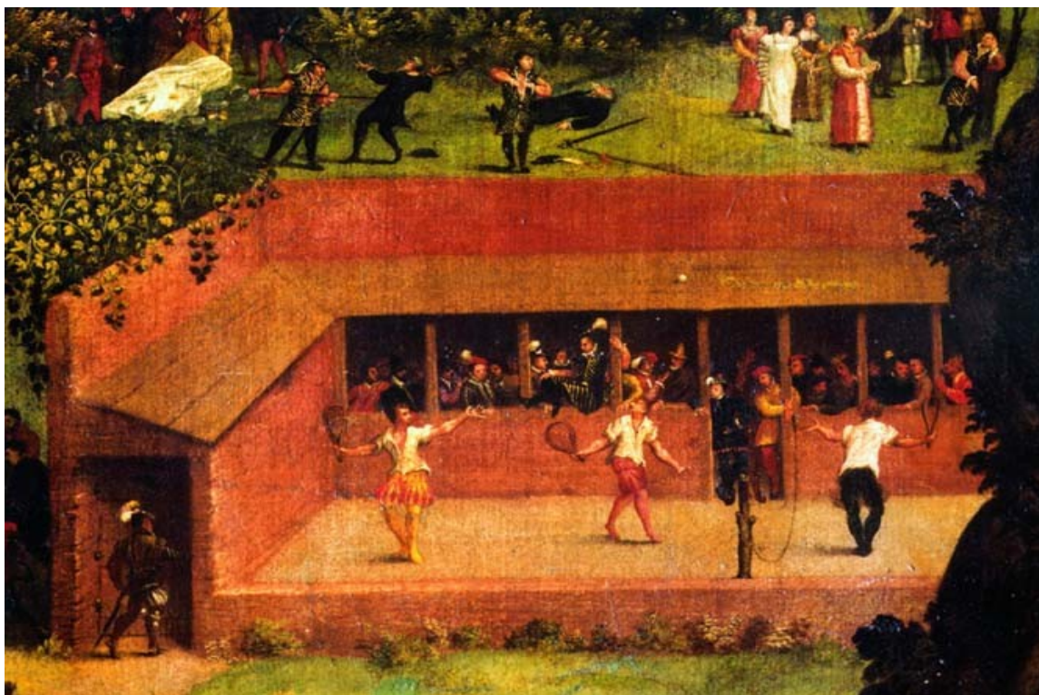
rappresentazione seicentesca della pallacorda

La pallacorda è un gioco antico, con alcuni aspetti simili alla pallapugno , praticato dal secolo XIII che nella sua evoluzione ha dato origine a pelota basca e tennis : il suo nome è questo poiché originariamente la palla doveva essere lanciata nel campo avverso superando una corda tesa a metà campo. In Italia probabilmente questo gioco derivò da un altro di origine latina e fu alquanto popolare nei secoli scorsi. Si diffuse molto in Francia tanto da diventare in breve il gioco più popolare e il primo sport professionale dell' evo moderno : infatti era praticato da atleti specialisti davanti un pubblico di migliaia di appassionati ai quali era consentito scommettere sui giocatori che si organizzarono in corporazione di professionisti nel 1571 ; nel secolo XVI solo a Parigi esistevano 250 campi per la pratica di questo gioco. SOULE