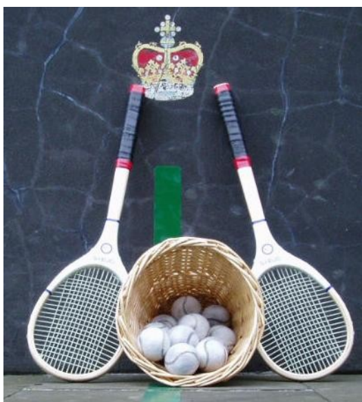
Racchette e palline del gioco attuale